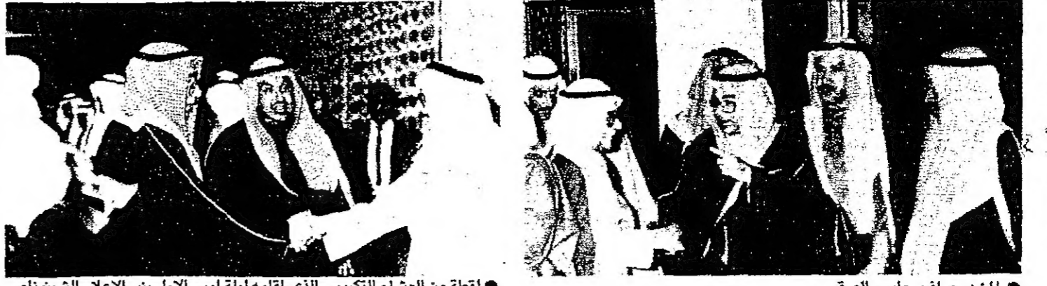
المؤيد يصافح جاسم الصقر

عقدت بمقر وزارة الاعلام قبل ظهر امس المباحثات الاعلامية الرسمية بين دولة الكويت ودولة البحرين برئاسة وزير الاعلام الشيخ ناصر محمد احمد الجابر، ووزير الاعلام بدولة البحرين طارق عبدالرحمن المؤيد.